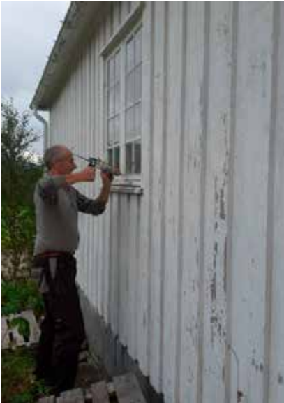
Kitting av vinduer

Menighetsrådsmedlemmer trådte til med maling av redskapshuset i Harran på dugnad, da det ikke var midler til å utføre arbeidet.